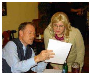
7 Jahre TextLabor Bergedorf - eine ganz besondere offene... von Charlene Wolff