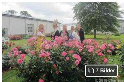
Hoheiten bei Rosen Tantau