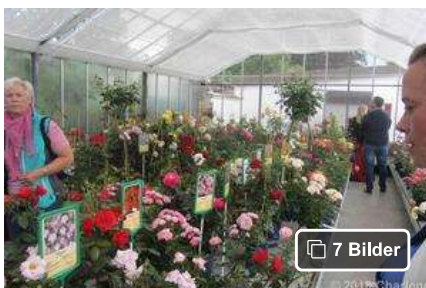
Rosen in voller Pracht zum Verkauf

In der Gegend um Uetersen ist der Boden lehmhaltig, wie ihn die Rosen lieben. Was ich gelernt habe ist, dass die Rosen, die wir heutzutage kaufen, veredelte Rosen sind. Von Rosen, die so sind, wie man sie haben will und durch Selektion in kleiner Stückzahl herangezüchtet hat, werden die sogenannten Augen abgeschnitten, deren Holz entfernt und das Grüne in die Stämme wilder Rosensorten hineinoperiert. Das Veredeln wird von Spezialkräften gemacht, die 3 Jahre brauchen, bis sie es richtig können, 2.500-3.000 Rosen pro Tag veredeln können und damit richtig gutes Geld verdienen. Da die Arbeit im Bücken ausgeführt wird, geht sie sehr auf die Beinmuskeln, und man kann sie nur einige Jahre machen.